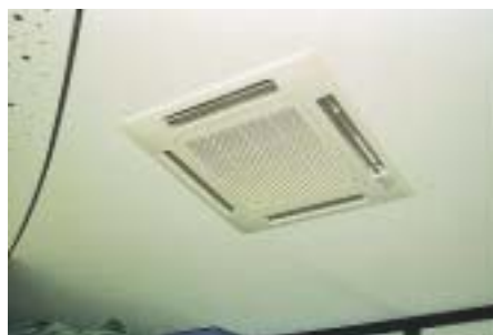
Innen wurden, wo möglich, Kassetten mit „unsichtbaren“ Leitungen installiert

Was folgte, war ein gutes Beispiel für verlässliche Arbeit im Kälteanlagenbau. GVP erteilte den Auftrag an die Firmen Johnson Controls, zuständig für das technische Gebäudemanagement der Dreba-Liegenschaften, und Schulz Ende Dezember 2000. Bereits im darauffolgenden