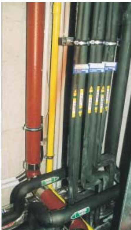
Über 900 m Kupferrohr wurden unter teilweise beengten Verhältnissen für die Kältemittelführung fachmännisch verlegt

Für die Versorgung der einzelnen Etagen stand nur ein sehr enger Versorgungsschacht zu Verfügung, der aber ausreichte, um die R 407C-führenden Kältemittelleitungen in die einzelnen Stockwerke zu führen. Von dort aus erfolgt anschließend die Verteilung des Kältemittels hin zu den jeweiligen Inneneinheiten in den Büros. Dies teilweise in einer schmalen Zwischendecke, wozu an verschiedenen Stellen Revisionsöffnungen erforderlich waren. Größten-