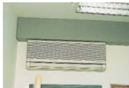
In den meisten Büros befinden sich mangels Zwischendecke allerdings Wandgeräte über den Türen, für deren Verrohrung ein Kanal harmonisch in den Räumen angebracht wurde, hier angedeutet über dem Gerät

Die Aufstellung der insgesamt 5 Außeneinheiten vom Typ SPW CR 903 GVH8 mit einer Gesamtkälteleistung von knapp 150 kW erfolgte in enger Anordnung auf dem Flachdach des Gebäudes. Das Gesamtgewicht von etwas über 1 t erwies sich dabei als kein statisches Hindernis. Im anderen Falle wären die Einheiten individuell verteilt auf dem Flachdach angeordnet worden. Und auch vereinzelt Bedenken, die Geräte könnten im Betrieb die unmittelbar angrenzenden Anwohner stören, erwiesen sich schnell als unbegründet. Auch die technischen Vorgaben