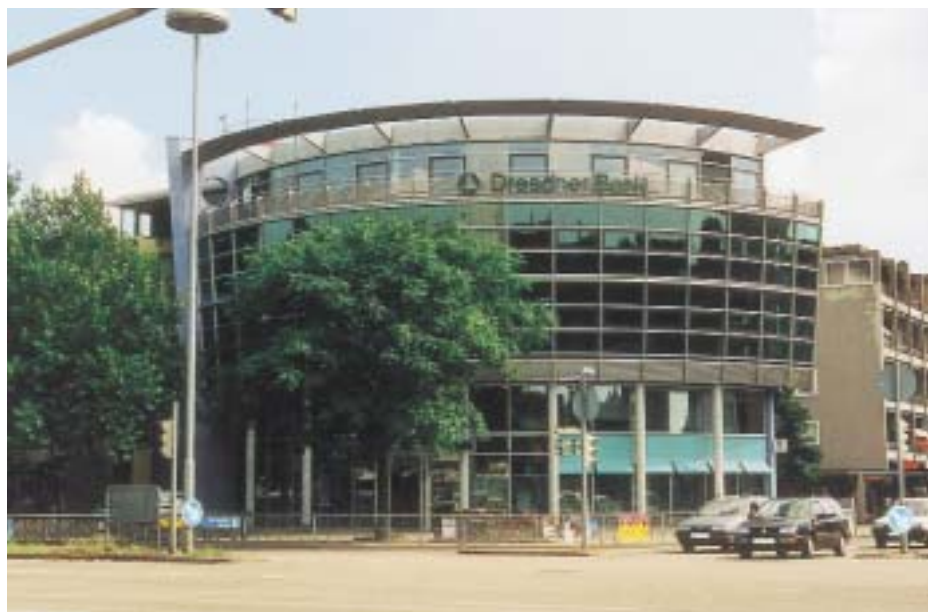
Mitte der 90er Jahre entstand dieser Neubau der Dresdner Bank in Kehl mit insgesamt 60 Büroräumen ohne Klimatisierung – ein Versäumnis, das nun durch die Installation eines VRF-Multisplitsystems behoben wurde

1995 entschieden sich die Eigentümer (DEGI) dafür, das alte Gebäude abzureißen und durch einen Neubau zu ersetzen. Das Ziel war es, ein Zweckgebäude zu realisieren, das einer Bank