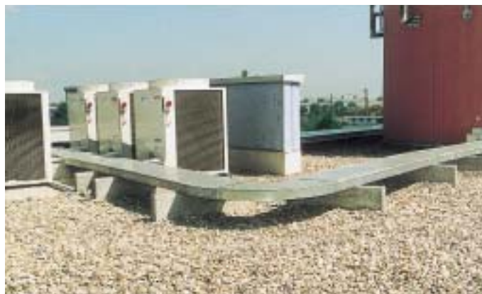
Sämtliche Leitungen führen über einen geschlossenen Kanal (zum Schutz für die Isolationen) von den 5 Außeneinheiten über den Versorgungsschacht (rosa im Hintergrund) zu den einzelnen Etagen

Die Aufstellung der insgesamt 5 Außeneinheiten vom Typ SPW CR 903 GVH8 mit einer Gesamtkälteleistung von knapp 150 kW erfolgte in enger Anordnung auf dem Flachdach des Gebäudes. Das Gesamtgewicht von etwas über 1 t erwies sich dabei als kein statisches Hindernis. Im anderen Falle wären die Einheiten individuell verteilt auf dem Flachdach angeordnet worden. Und auch vereinzelt Bedenken, die Geräte könnten im Betrieb die unmittelbar angrenzenden Anwohner stören, erwiesen sich schnell als unbegründet. Auch die technischen Vorgaben